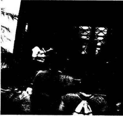
Estudiantes de la universidad De San Carlos